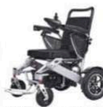
1,2 miljoner kronor är priset för 100 elektriska rullstolar.

- Vi köpte en och tog hit den. Jag satte mig och bör-