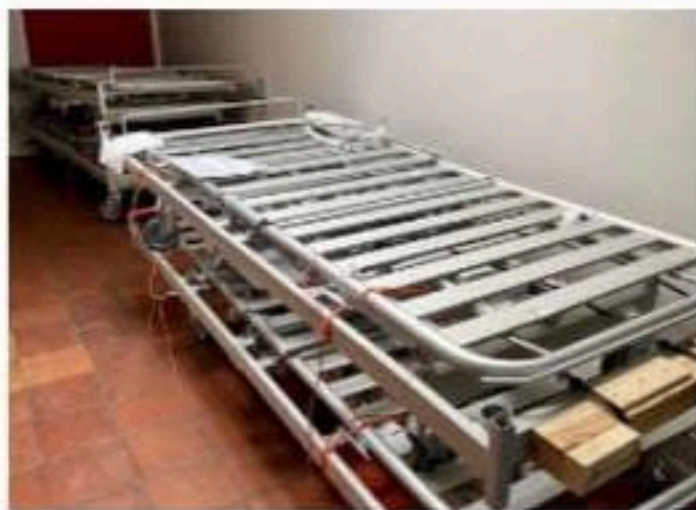
Sjukhusen i Ukraina är i stort behov av förnödenheter.